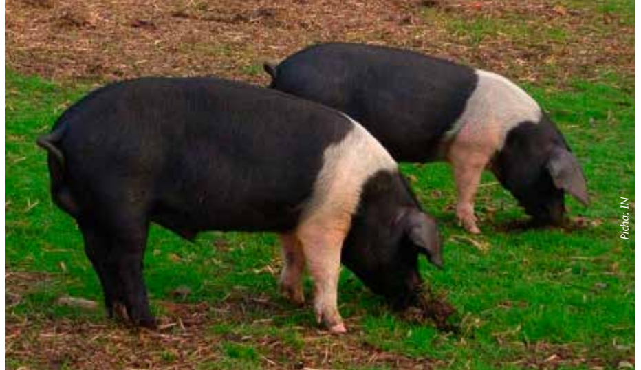
Nguruwe wanahitaji malisho bora ili kupata uzalishaji unaokidhi soko