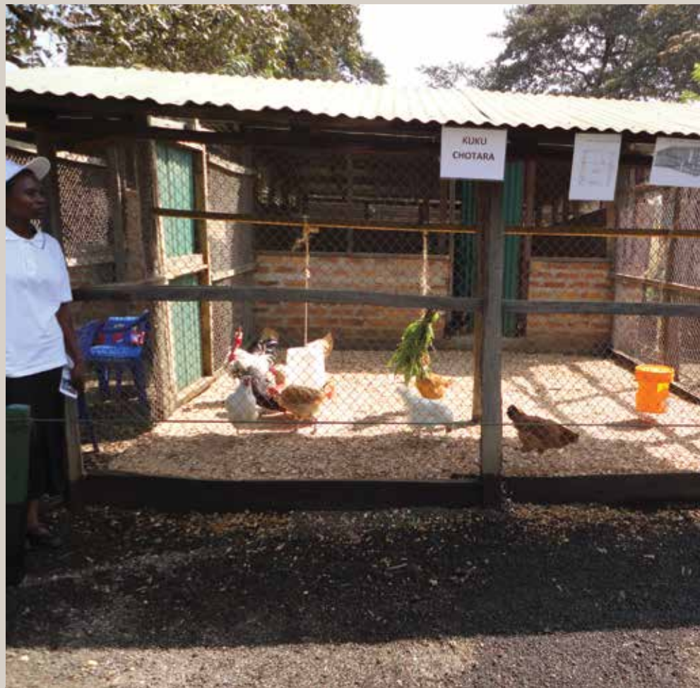
Ni muhimu kuwa na banda bora linalokidhi mahitaji ya ufugaji wa kuku