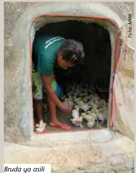
Bruda ya asili

Mfugaji anaweza kulea vifaranga wengi kwa kutumia bruda ambayo ni mduara. Bruda hiyo inaweza kutengenezwa kwa kutumia mbao, karatasi ngumu au kwa kuziba pembe za chumba.