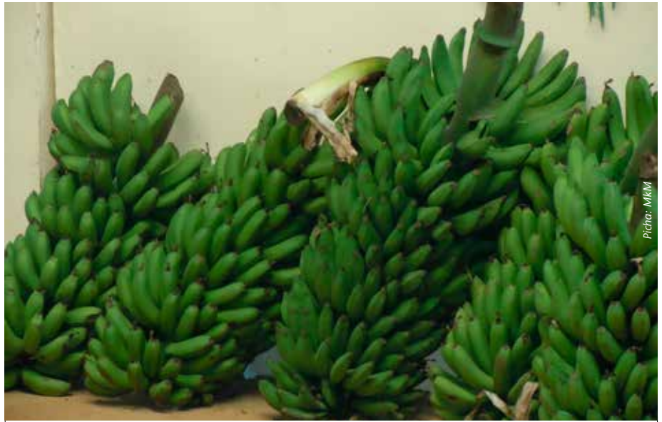
Ndizi zilizozalishwa kwa kufuata kanuni bora huonekana dhahiri wakati wa mavuno

Kiasi cha joto kinachofaa ni nyuzi joto za sentigredi 25 hadi 30 chini ya nyuzi joto 16 migomba haikui vizuri. Migomba hustawi vizuri kwenye udongo wenye rutuba ya kutosha, kina kirefu, usiotuamisha maji na pia usiwe na chumvi.