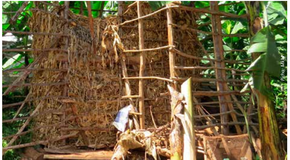
Mabaki ya mahindi yavunwe na kuhifadhiwa kwa ajili ya malisho wakati wa ukame